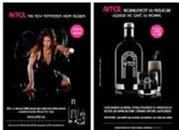
デザインを変更した After のキャンペーン広告。 実際の出版物は二つの広告の間には紙面がありました。

様々な調査を組み合わせるテクニックは、消費者の広告認知に関する十分な洞察を提供します。私たちは、視覚刺激への注意が人の特性(予備知識、願望など)と視覚刺激の特性(コントラスト、配置など)の両方から影響を受けるということを知っています。