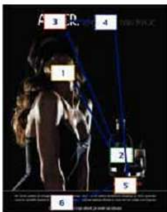
After 広告の、全体的なリーディングパターン

Rogil はメーカーに、製品をわかりやすく配置し、また、製品と一致するシンボルを使用することを勧めました。この提案は、After の次のプリント広告キャンペーンで採用されました。デザイン変更後の広告は、製品とその特性を手前に持ってきています。さらに製品説明は短縮され、フォントサイズは大きくなっています。また、商標はピンクのハイライトで強調されました。使用されているシンボルはそれほど明示的ではありません。