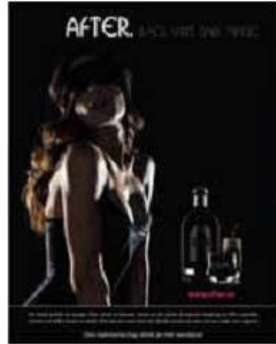
調査した A4 サイズの After のプリント広告

全ての広告を見終わった後、被験者はそれらを比較してその要素(魅力、分かりやすさ など)について、口頭で表現しました。さらに、一步踏み込んだ定性的なインタビューで After の広告から連想されたものと、感じた気持ちを探りました。